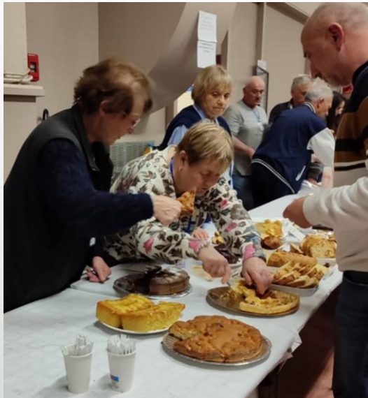
De nombreux lots