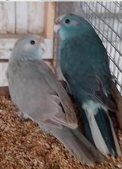
PERRUCHE KAKARIKI JAUNE A FRONT ROUGE OU PERRUCHE DE SPARRMAN CYANORAMPHUS NOVAEZELANDIAE