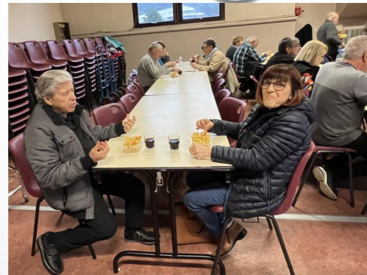
Moment du repas toujours agréable, Au menu : saucisses frites. Merci à l'équipe de la cuisine. !