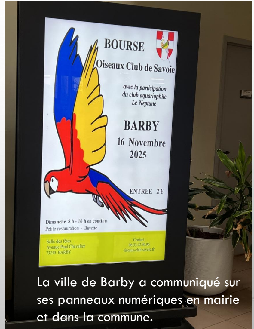
La ville de Barby a communiqué sur ses panneaux numériques en mairie et dans la commune.

Contact : 06.33.42.96.96 oiseaux-club-savoie.fr