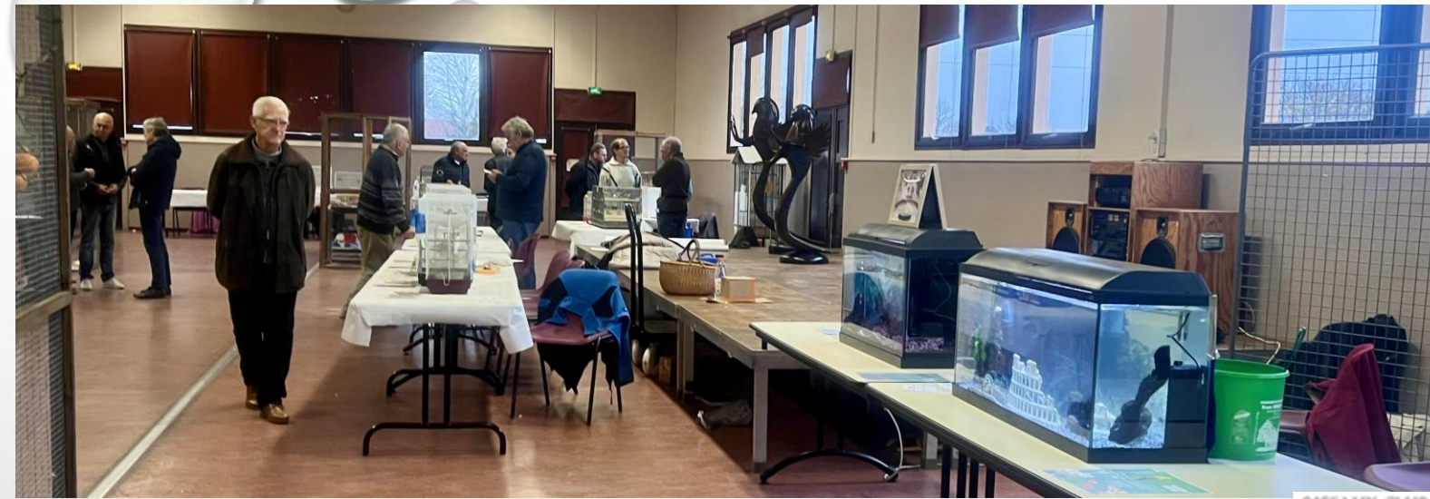
Présence du club Neptune avec deux bacs de poissons,